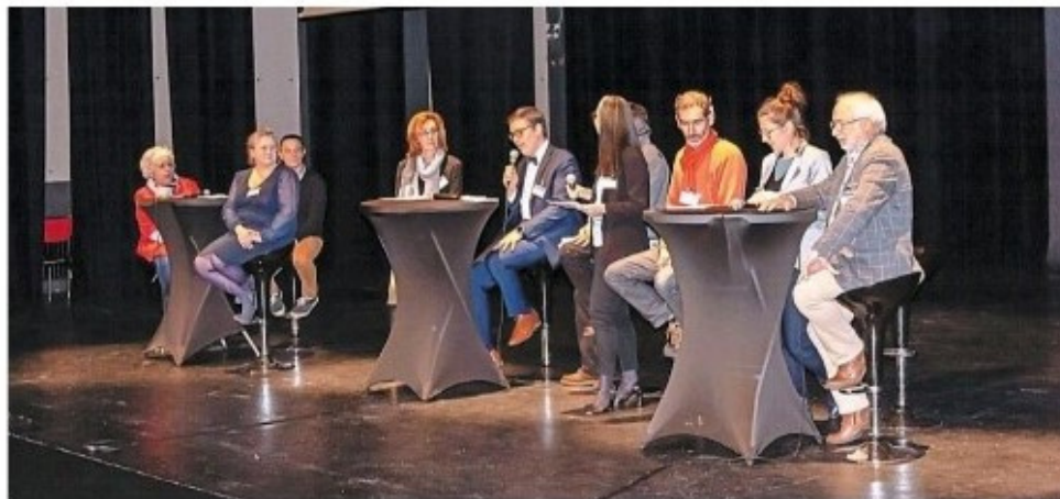
Une partie de l'équipe municipale et le maire ont présenté leur bilan après deux ans et demi de mandat.

elles sont au cœur du quotidien : la réduction des horaires d'éclairage est en place, certains bâtiments publics seront revus, la plantation d'arbres se poursuivra et la chaudière de l'école est alimentée par du bois coupé à Bouvron.