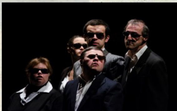
Les comédiens du Cercle Karré entraînent le spectateur dans des tableaux sans paroles, mais lourds de sens.

■ Vendredi 7 avril à 20h30, salle du Pontrai. Entrée gratuite.