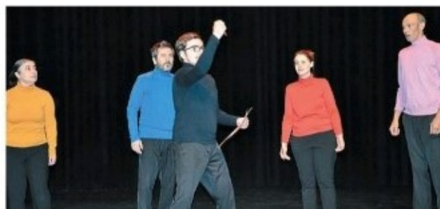
En clôture de la cérémonie des vœux de Pays de Blain communauté, la compagnie du Cercle Karré a présenté son spectacle, Six % .

La compagnie du Cercle Karré est un établissement et service d'aide par le travail (Esat) culturel et artistique, créé en 2015.